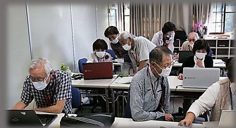
いなみ野祭に向けて、Dアート・Wアート作成中